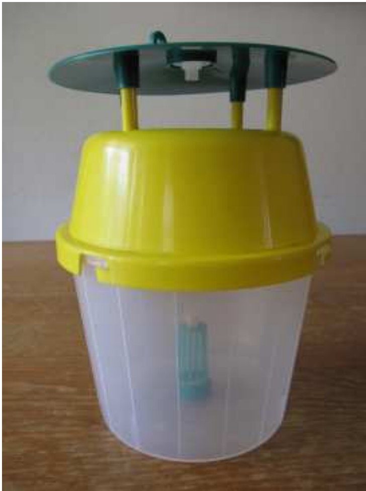
Figuur 3: De val zit in elkaar

Zet daarna de rest van de val in elkaar (zie figuur 3) en maak een touw vast aan de 2 ringen op de deksel zodat je de val kan ophangen.