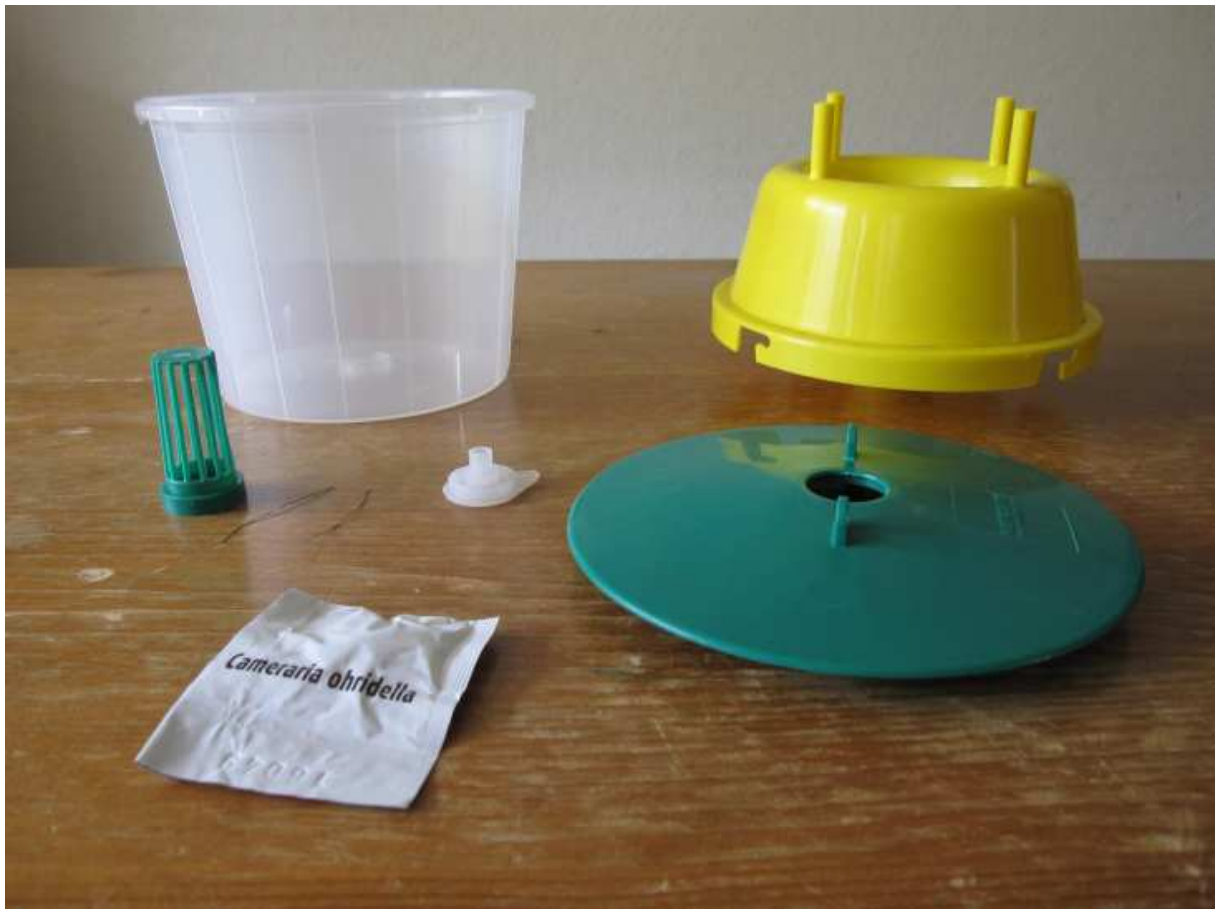
Figuur 1: Benodigdheden voor een feromoonval

De val kun je simpel zelf in elkaar zetten met deze onderdelen: