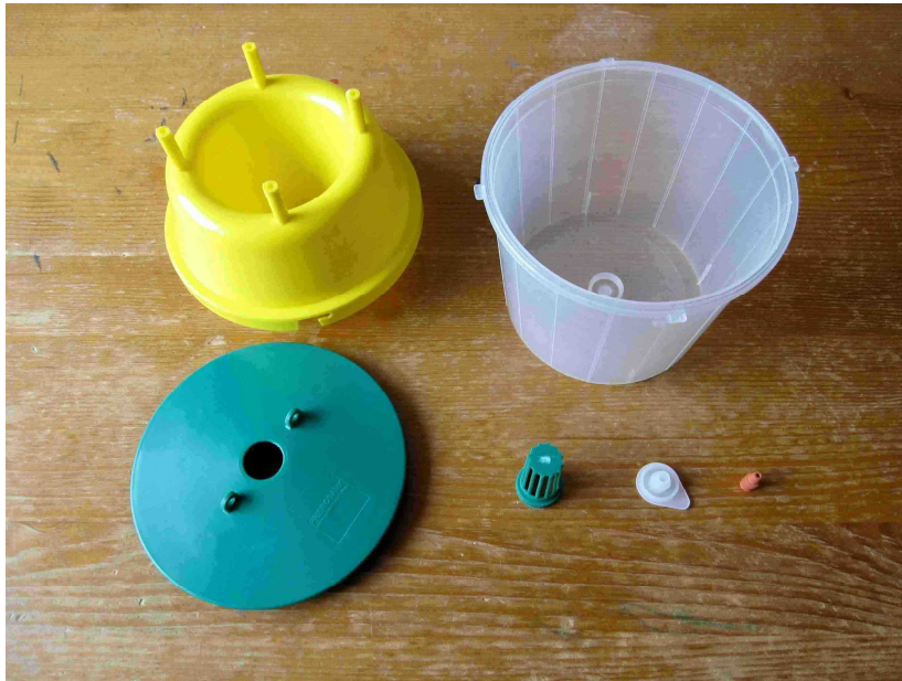
Figuur 1: Benodigdheden voor een feromoonval

De val kun je simpel zelf in elkaar zetten met deze onderdelen: