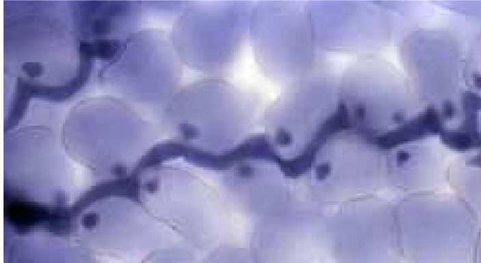
Figuur 3: Microscopische opname van haustoria in bladcellen. De hyfe groeit tussen de bladcellen door. Dit is overigens niet P. infestans , maar een andere oömyceet (valse meeldauw in Arabidopsis thaliana ).

Voor de vorming van een netwerk van hyfen (mycelium) is veel energie nodig. In het blad vormen de hyfen daarvoor speciale structuren. Een hyfe dringt plaatselijk de plantencel binnen en vormt daar een soort ballonnetje, het haustorium. Met dit haustorium zuigt de ziekteverwekker de voedingsstoffen van de gastheer op voor eigen gebruik. Op deze manier kan Phytophthora steeds verder groeien ten koste van de plant.