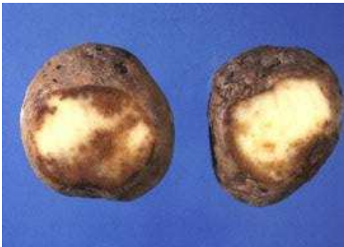
Figuur 1: Aardappels geïnfecteerd met Phytophthora . Eet smakelijk!

In het practicum heb je onderzocht of jouw aardappelplantje een resistentiegen heeft tegen aardappelmoehheid. Deze ziekte wordt veroorzaakt door het aardappelcystenaaltje. Maar een aardappelplant heeft nog veel meer vijanden. Onkruiden concurreren met aardappelplantjes om licht, water en voedingsstoffen. Daarnaast worden aardappelplanten aangevallen door allerlei verschillende insecten, schimmels, bacteriën en virussen. Maar de grootste bedreiging voor een aardappelplant is toch wel de aardappelziekte Phytophthora (fytoftera).